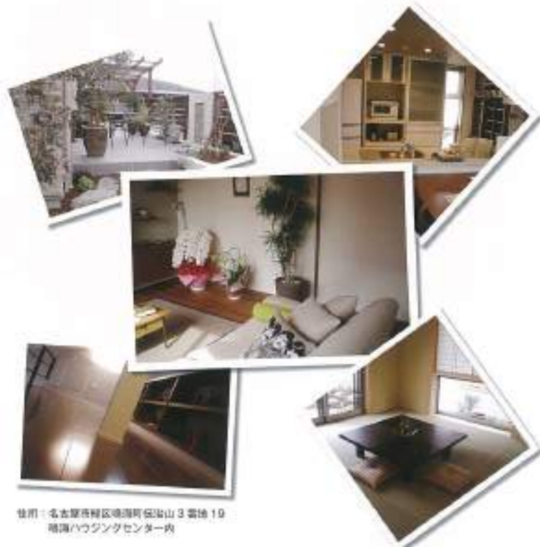
住所：北名古屋市緑区鳴海町安山3番地19 イクメンハウス展示場内

部屋に飾ってあるお気に入りのおものに囲まれて、週末にはワインディカフェを開き、こだわりのコーヒーや自慢の料理をご近所さんやお友達に振る舞うお父さん、お母さん。子どもたちはそんな様子を見ながらその感性を受け継いだり、人や社会とのかわり方を覚えていくのかもしれない。自分のこだわりを大切にしながら、それを人とシェアしたい。とお考えの方は、ぜひ鳴海展示場にお越しください。