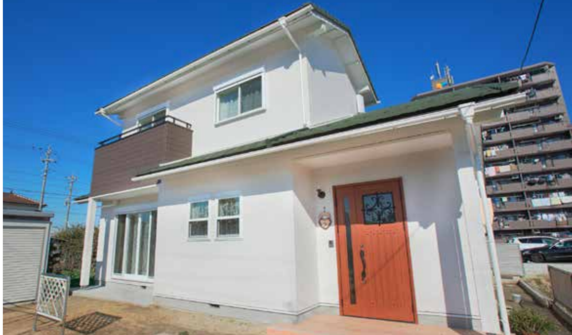
グリーン屋根が個性的なO様邸