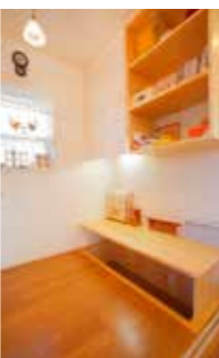
奥様の作業スペース。机の下は掘りこたつ風に