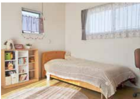
一点一点丁寧に選ばれたインテリア