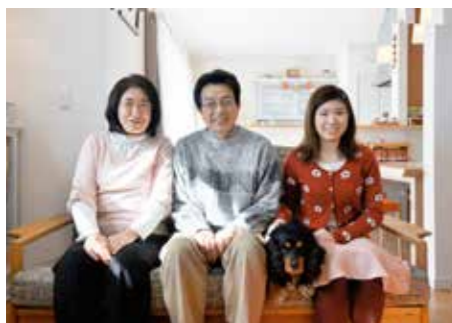
「私の夢が叶った家です」と奥様