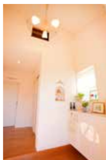
玄関にも奥様手作りの作品がずらり