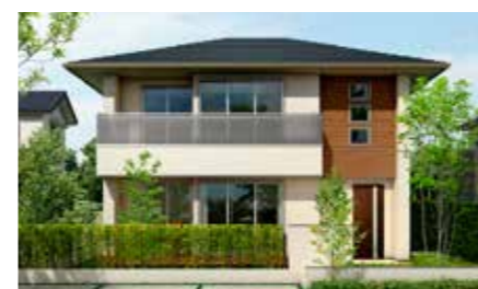
若い世帯に人気の4C-styleが標準仕様で長期優良住宅対応