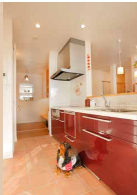
キッチンの床はタイル貼りに