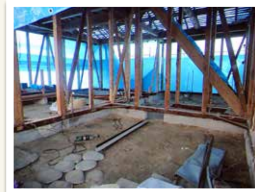
床と壁・天井を抜き、構造材だけの状態にした様子。