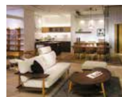
柏木工名古屋ショールーム Jホームスタイル

に一度交換が必要になりますが、木だけでできた椅子ならそれも不要です。これらの技が光る一押し家具は、ウインザーチェアと呼ばれる椅子。細い脚、細長い背棒が特徴です。 柏木工さんでは、どの家具も一生涯使うことを想定して作られています。それは、10年補償にも現れています。また、20年、30年後に廃盤になつていたとしても、有料で職人が直してくれます。 今後は、リフォーム事業にも力を入れていくそうです。家具は、壁紙や床の色に近い色味を揃えるのが一般的です。実は柏木工さんはドアなどの建材も製造しており、家具と内装を色だけでなく、デザインや材質まで同じものにする事ができます。人生の節目に、家具も内装も模様替えをしてみるのも、面白いですね。 名古屋にあるショールーム「Jホームスタイル」にも一度足を運んでみてはいかがでしょうか。