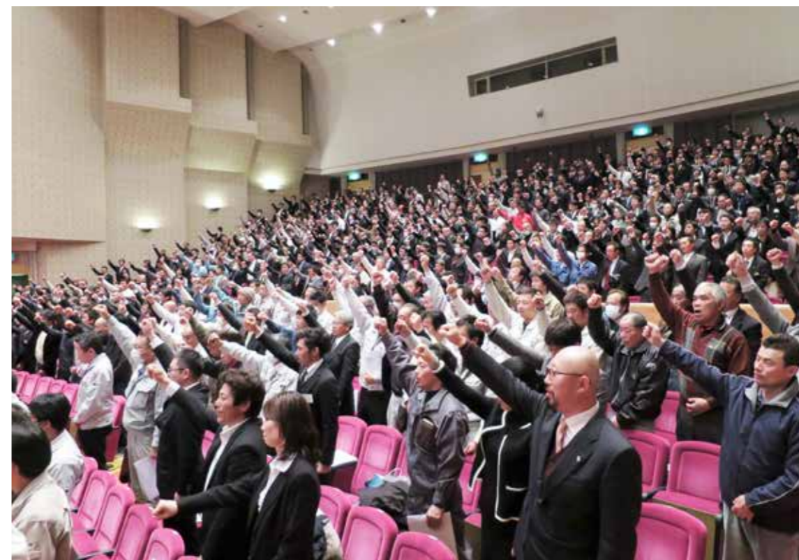
660名の参加者全員で「エイエイオー!」