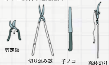
剪定鋏 切り込み鋏 手ノコ 高枝切り