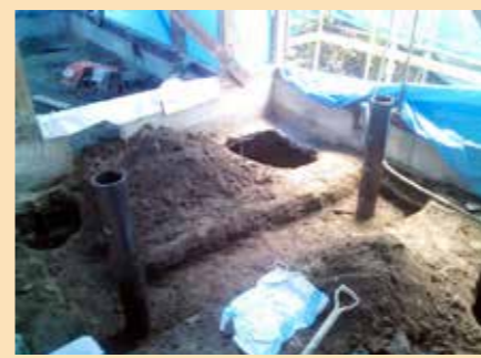
▲地盤の強化のために床下を40ヶ所掘り、杭を打ちました。