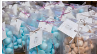
可愛い焼き菓子も目白押し

岐阜市の柳ヶ瀬商店街で、月1回、「手づくり」と「こだわり」の詰まった岐阜県最大のライフスタイルマーケットを開催しています。洗練された木工家具や、食材や製法にこだわった行列のできるお菓子、オーガニックフード、個性が光る雑貨やアクセサリ。レトロな柳ヶ瀬商店街のアーケードや空きビルにその日だけ現れる魅力的なお店たちに、ワクワクしてみませんか。