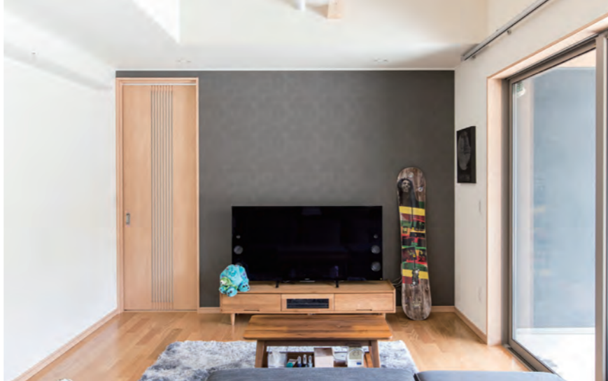
【リビング】 シンプルながらセンスの光るインテリア