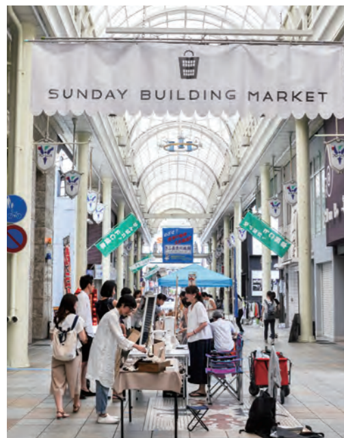
アーケード街のマーケットだから雨の日も安心