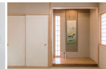
和室には思い出のある掛け軸