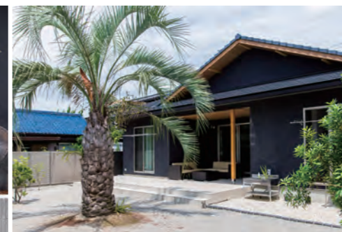
大きなヤシの木はT様邸のシンボルツリー