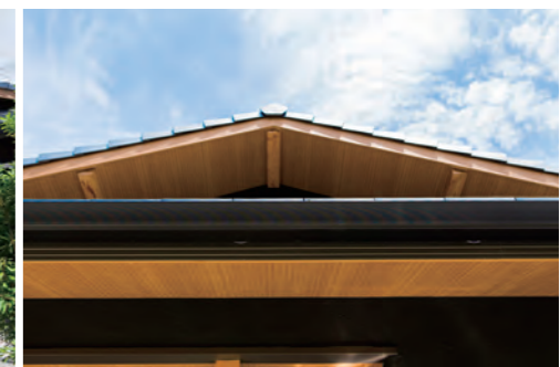
伝統の技が光る入母屋造りの屋根

スペースです。気の置けない仲間と肩を並べてお酒を味わえるバーカウンターでは、ご主人の弟さんがキッチンでおすしを握って出してくれたこともあるそう。ご夫妻が木材の倉庫で自ら選んだという一枚板のカウンターや、クウォーツストーンの光沢が美しいキッチンの天板、大工が付けてくれたお酒の棚も、楽しいひと時を華やかに盛り上げています。 大切な人とのつながりを感じて T様邸のシンボルとも言えるヤシの木は、植木を扱うお仕事をされているご主人のお父様が選んだものだそうです。「レモンやスタチも植えてもらい、とれたての実を絞ってはお酒と一緒に楽しんでいきます。」玄関側の日本庭園も、お父様とご主人のお二人で苔や杉を植え作られました。燈籠のある坪庭は、友人の庭師の方によるもの。親しい人たちと過ごす時間を大切にすることが夫婦のお人柄が、住まいにもあふれています。 「仕事から帰って、シャワーを浴びた後にテラスで一服するのがこの上なく幸せ」とご主人。賑やかに過ごす時間も、ゆったりとくつろぐ時間も、たくさんの人の思いが詰まった家が優しく包んでいるようです。