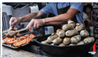
体に美味しい手作りごはんがたくさん