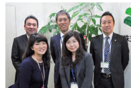
■株式会社エフケイ 名古屋市中区丸の内2-2-15 東照ビル1階 ※お問合せは、新和建設の営業担当へ

「ご家庭によって備えるべき金額や内容は違います。お家のメンテナンスを頼まれるように、家計全般についても気軽に新和建設の営業さんへお話しください。」 ご自宅でも展示場でも、お好きな場所でファイナンシャルプランナーがご相談に応じます。