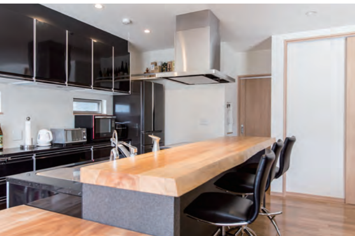
【キッチン】 気の置けない仲間と肩を並べてお酒を味わえるバーカウンター