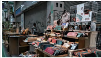
職人から直接雑貨を買えます