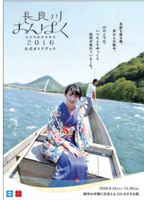
長良川おんぱく2016 公式ガイドブック