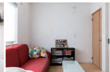
子供部屋は和室と繋がっています