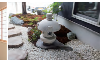
友人の庭師による坪庭