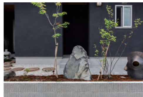
庭石や設楽焼の置物にもこだわりが