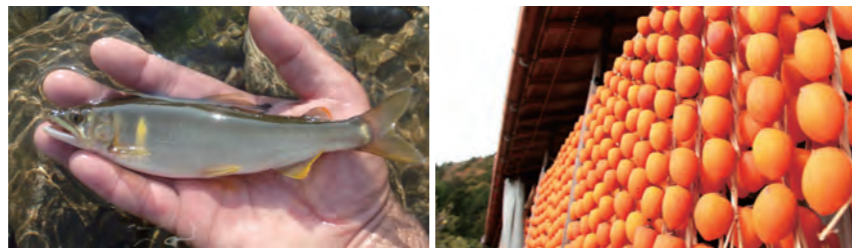
岐阜の秋の風物詩、伊自良連柿

今年も、岐阜市を中心とした長良川流域の市町村各地で、一ヶ月間、遊び、出会い、学び、美しくなる、150以上の体験プログラムが開催されます。川漁師と同行して舟に乗った後、獲れたてを寿司屋で味わったり、岐阜の舞妓さんと気軽なお値段でお座敷遊びを体験できるカフェを楽しんだり。「岐阜にこんな人がいたんだ!」「岐阜って結構いいとこだなあ」そんな感動が詰まった体験を味わってみませんか?