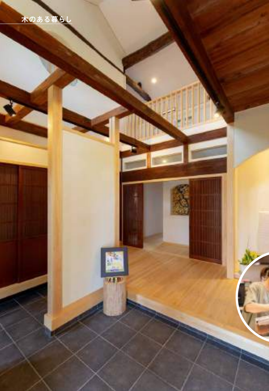
吹き抜けが圧巻の広い玄関