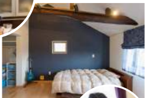
勾配天井で空間が広々と使われているお部屋