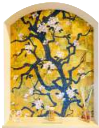
ひと目惚れした壁紙を活かした壁面棚