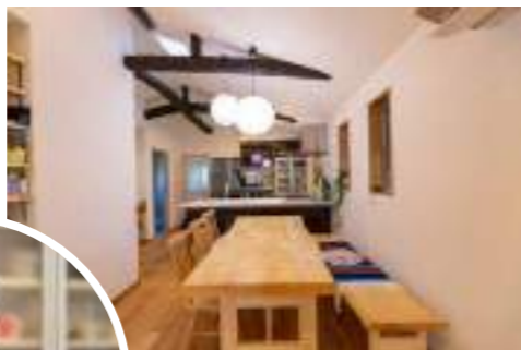
一枚板の大きなダイニングテーブル